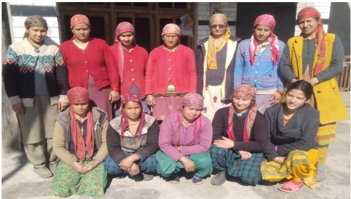
जगरनथी समूह के सदस्या