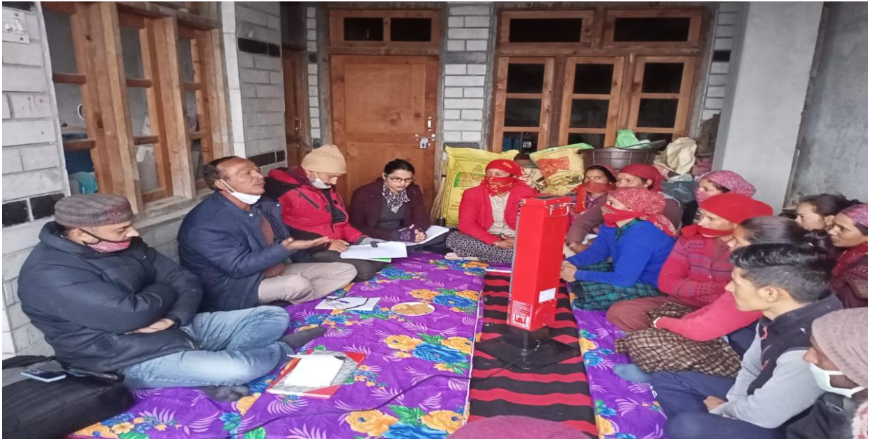
व्यवसाय योजना तैयार करते समय सामान रुची समूह से वार्तालाभ